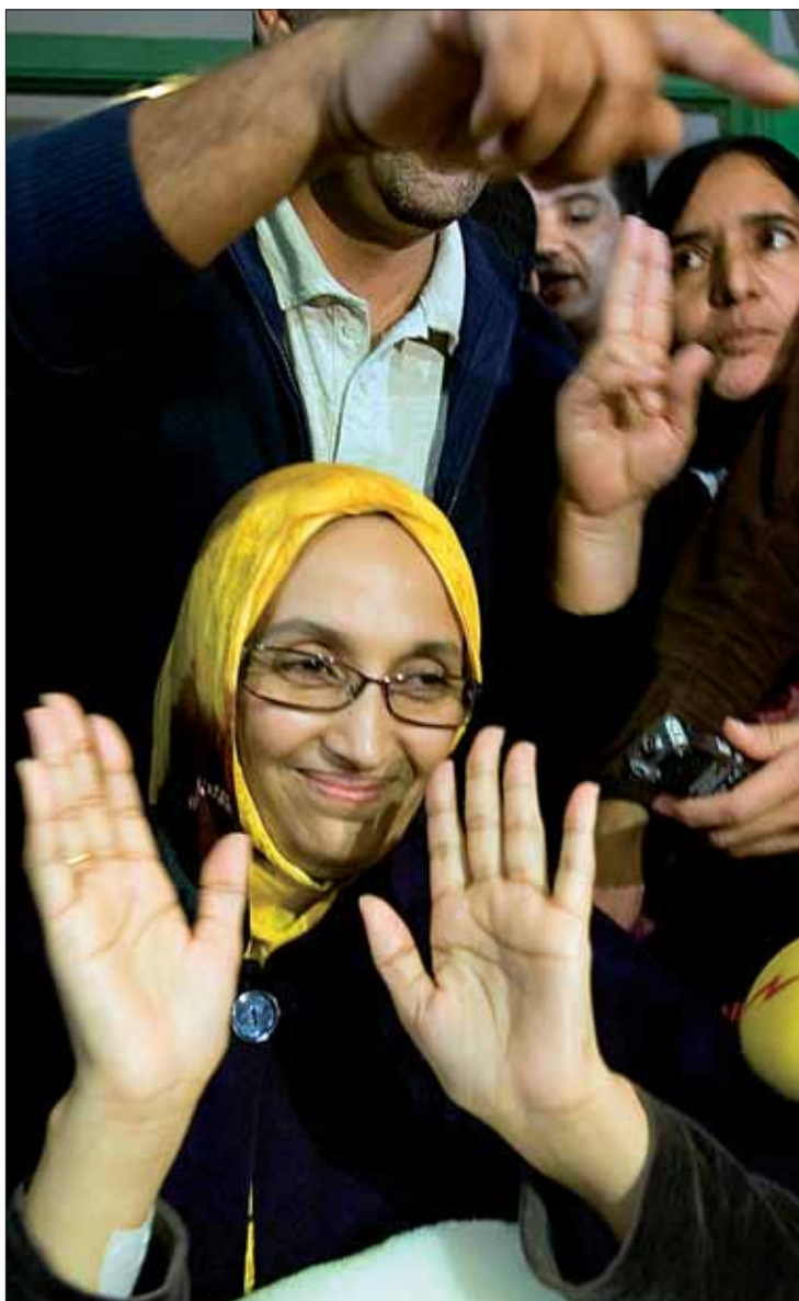
Haidar atendió a los medios antes de salir del hospital.

Akordioa lortzeko aukerak agortzen ari dira Kopenhagen