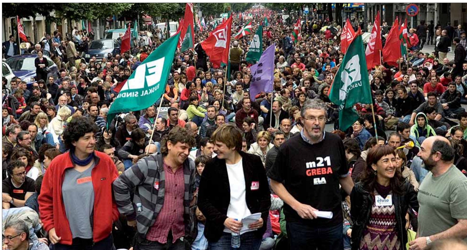
Los secretarios generales de los sindicatos convocantes, de pie al frente de la manifestación que recorrió a mediodía el centro de Bilbo.