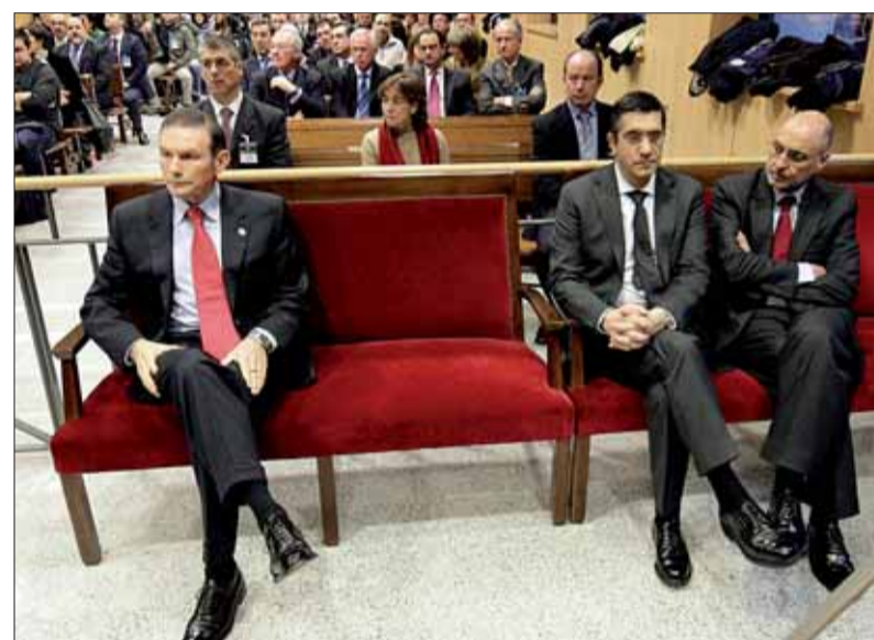
Los dirigentes independentistas bromean en su reencuentro en la sede del tribunal, sentados en los banquillos contiguos a los que ocupaban el lehendakari y los acusados del PSE.