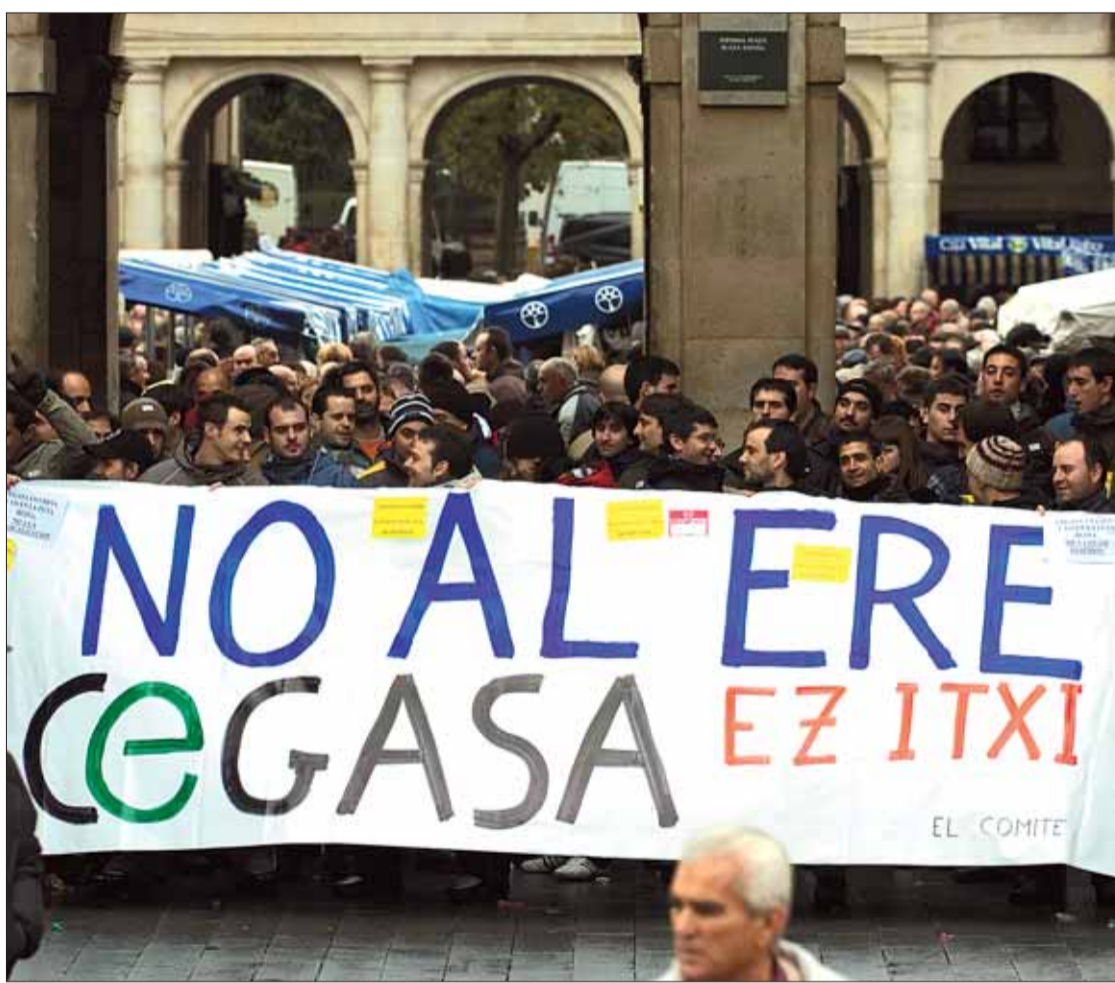
Los trabajadores de Cegasa llevaron su protesta a la feria de Santo Tomás de Gasteiz.