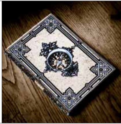
Ilustración: Carlos PATIÑO

NO SON POCOS LOS ESCRITORES QUE HAN HECHO DE SU VIDA UN COMPLEMENTO A SU ESCRITURA VIAJERA; ALGUNOS DE ELLOS NOS HAN DEJADO TÍTULOS INOLVIDABLES.